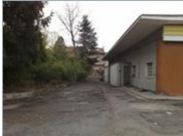
LISSONE (MI) Via Trieste